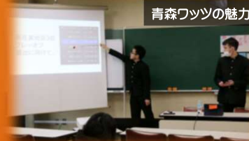
青森ワッツの魅力

ワッツのがんばりやワッツへの愛が伝わってきました。いろんな企画を立ててファンの方やバスケットに興味がある人が見に行きやすい環境ですごいとも思いました。未経験だけど、見に行ってみたいとも思いました。