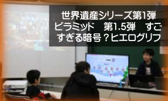
世界遺産シリーズ第1弾 ピラミッド 第1.5弾 すこ すぎる暗号？ヒエログリフ